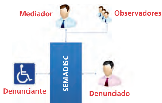
Esquema de funcionamiento de la mediación