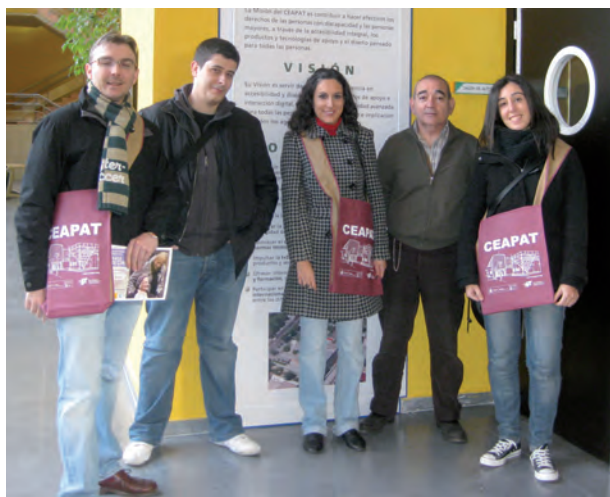
Visita de algunos Cibervoluntarios al Ceapat

En la actualidad y gracias a centros como el Ceapat existen en el mercado multitud de alternativas desarrolladas tras un estudio exhaustivo de cada discapacidad y orientadas a facilitar la e-inclusión. Hablamos de teclados ergonómicos, teclados para una sola mano, teclados virtuales, ratones de cabeza, ratones controlados por el iris, programas de reconocimiento de voz, etc.